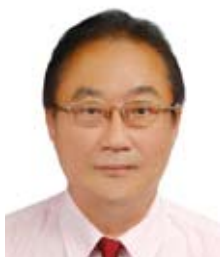
首先請巨獅雜誌社玟棕社長發言