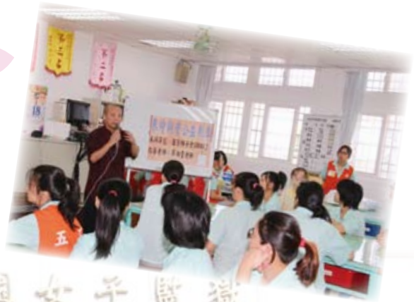
法務部矯正署桃園女子監獄